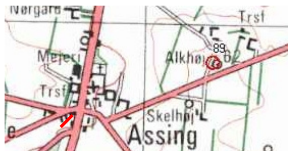
Syrenstien vist med rød

http://www.geografforlaget.dk/landskaber/lokaliteter/default.asp?cid=289 )